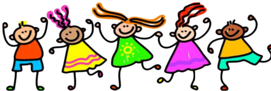
Team bs de Klingerberg

Een brug verbindt landen- mensen- twee scholen!